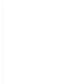
Рис. 1. Название рисунка

Текст. Текст. Текст. Текст. Текст. Текст. Текст. Текст. Текст. Текст. Текст. Текст (рис. 1).